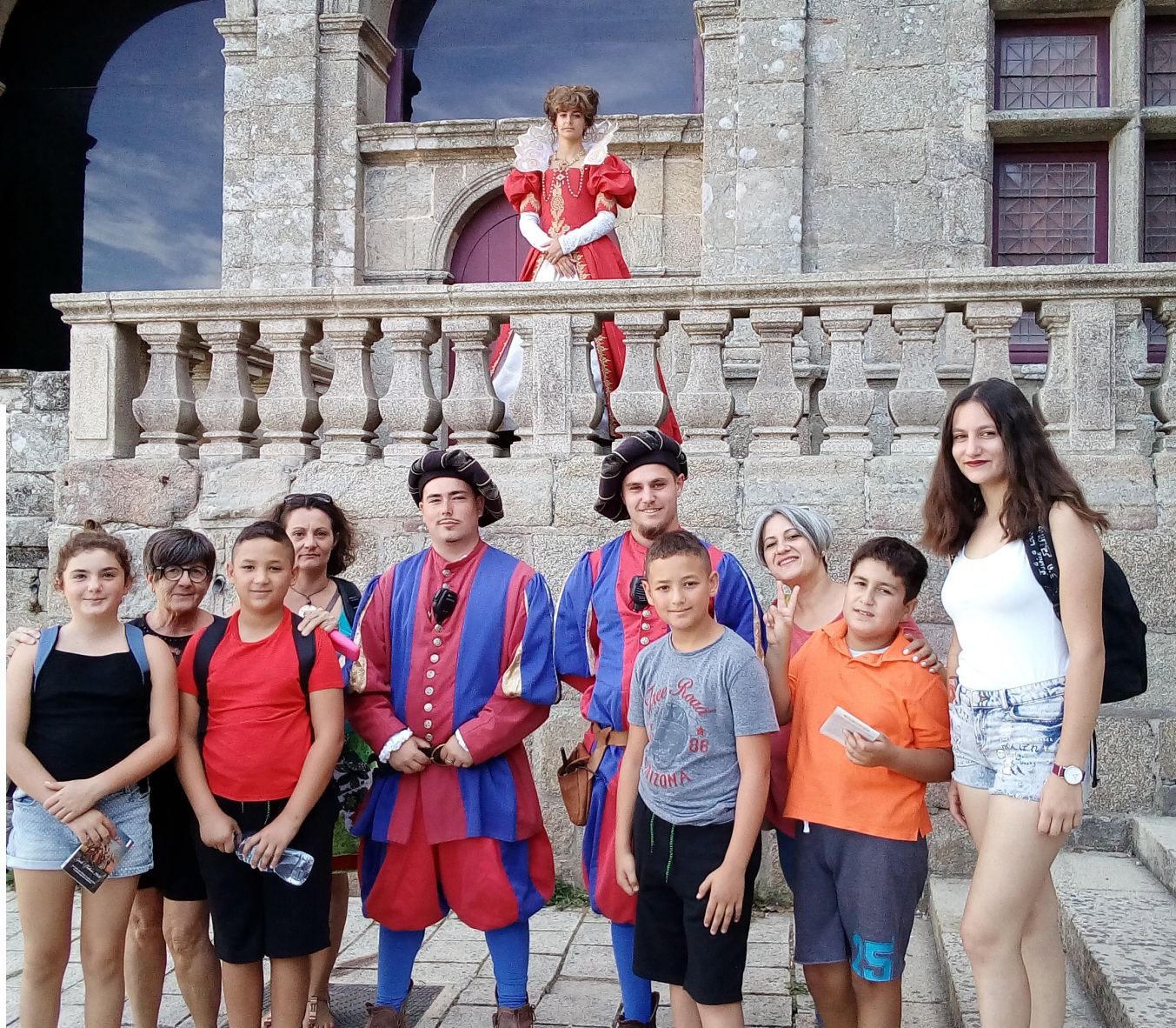
à gauche : soirée années 80 - 01 dec 2018 au dessus : séjour Puy du fou septembre 2018

Cette expérience a été très positive aussi bien pour les habitantes que pour la Maison de Quartier. En effet, les habitantes et leurs enfants se sont mobilisés et ont été pleinement acteurs des différentes étapes du projet : mobilisation autonome sur les inscriptions de la soirée années 80, communication auprès des commerces du quartier, sollicitation des radios pour diffuser autour de leur projet, sollicitation d'habitants du quartier pour que leur soit prêté du matériel utile à la soirée (décors, sono), mobilisation d'un chantier jeunes pour la gestion des repas lors de la soirée années 80 etc. Ce projet, initialement individuel, n'a pas seulement répondu à leurs besoins immédiats. En effet, il a rayonné sur l'ensemble de la Maison de Quartier et a permis de mobiliser des jeunes dans le cadre d'un chantier visant à financer une activité et de proposer une animation de vie locale. Par ailleurs, un grand nombre d'habitants ont pu exprimer que ce